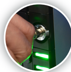
Tranca interna de acesso ao dinheiro