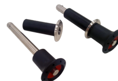
Sistema de ancoragem removível (Opcional)